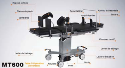
MT600 Table d'Opération Universelle